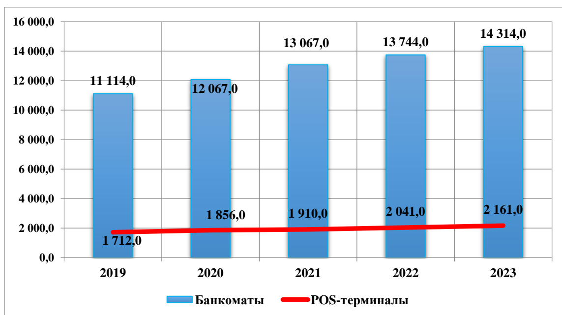
Рис. 3. Динамика количества банкоматов и POS-терминалов за 2019-2023 гг. [4]

Поэтому при выборе расчетного банка для операторов платежных систем/платежных организаций важно учитывать все эти факторы, а также обеспечить операторам доступ к необходимым критериям для эффективной работы и развития платежного бизнеса [4]. Внимание к выбору расчетного банка позволит оптимизировать финансовые операции, повысить качество обслуживания клиентов и улучшить показатели платежной системы в целом.