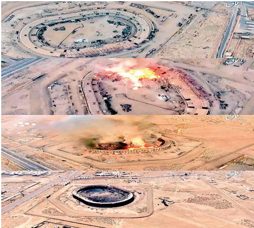
Рисунок 2. Последствия применения БпЛА в Дейр-эз-Зоре в 2017 году

Таким образом, первоочередные практические рекомендации командирам не прикрытых средствами РЭБ и ПВО элементов системы связи для повышения защищенности личного состава и объектов хранения боеприпасов от БпЛА можно сформулировать следующим образом: